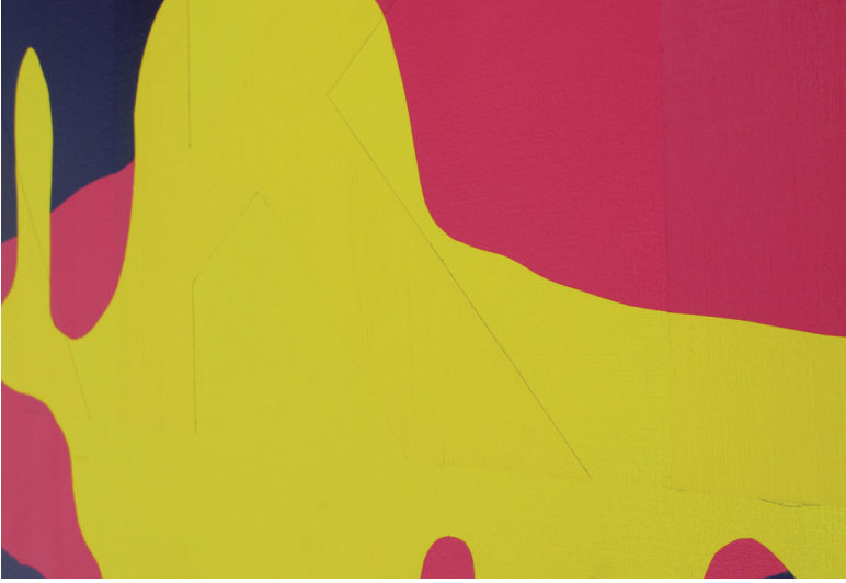
Faking, 2010 - Acrylique sur toile, ø 170 cm