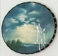
Sublime shoots, 2010 Huile sur toile, cuir et clous, 47 x 57 cm