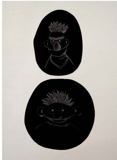
Gauche/Droite, 2010 - Acrylique sur papier, sur toile, dimensions variables