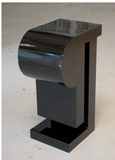
TOC, 2009/2010 - Acrylique sur toile, 105 x 250 cm ■ SPLATCH, 2010 - Bois et acrylique, dimensions variables ■ ¶, 2010 - Bois et peinture laquée, 70 x 30 x 43 cm